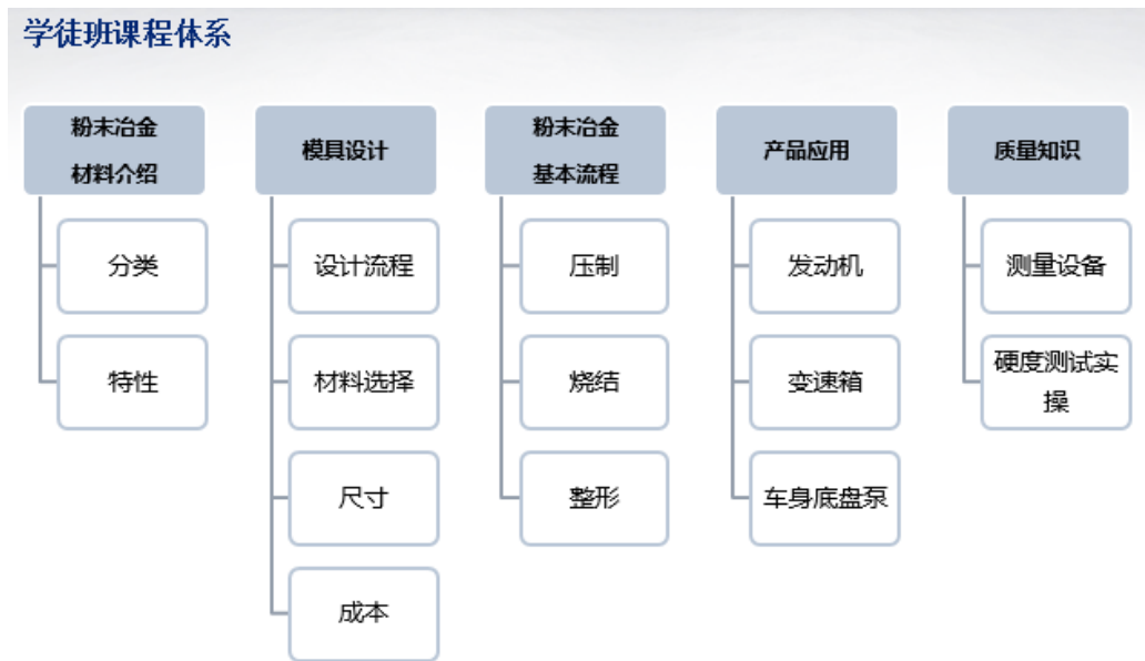
图 1 学徒班企业课程

完善学徒班课程体系。 制订“公共课程+核心课程+教学项目”为主要特征的适合现代学徒制的校企一体化课程体系，并按照“企业用人需求与岗位资格标准”设置课程。学徒班企业课程如图 1 和表 1 所示。